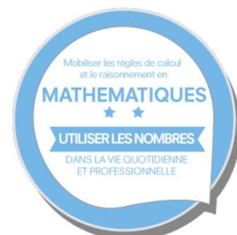
Exemple de badge numérique

Le badge est le symbole d'une réalisation réussie ou d'une compétence acquise. Un badge peut également attester la participation à une activité.